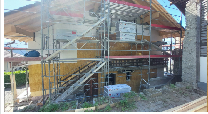
LAINE DE PIERRE